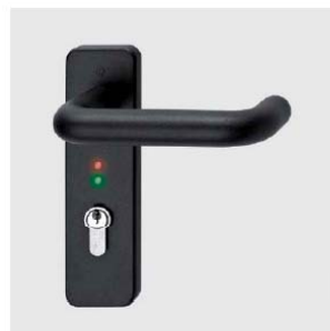
Poignée en plastique, LED rouge/verte

Cette fonction permet l'activation de la poignée par contact électrique (non fourni) en continu, pour une plus longue durée (par exemple pour toute une journée). Le témoin vert reste allumé tout le temps pendant lequel la poignée est activée. Pour les portes avec le système préinstallé, le témoin vert s'éteint pendant l'ouverture de la porte jusqu'à la fermeture complète.