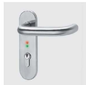
Poignée inox, LED rouge/verte